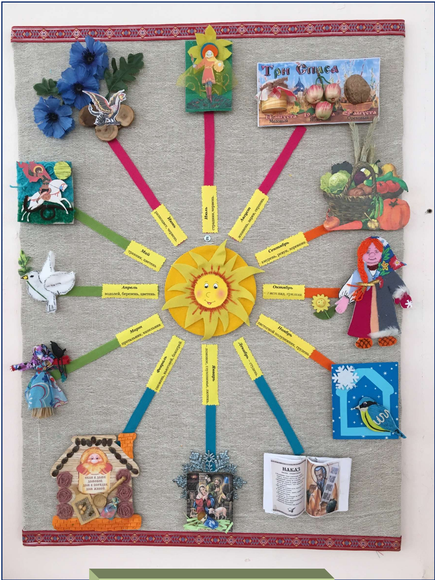
Народный календарь Июль